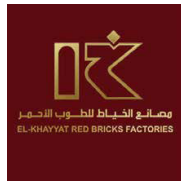
EL-KHAYYAT RED BRICKS FACTORIES