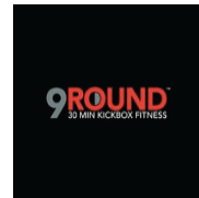
ASCOTT RAFAL OLAYA RIADAH