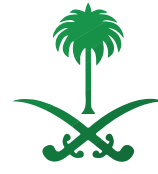
Palaces of Prince Nayef bin Abdulaziz